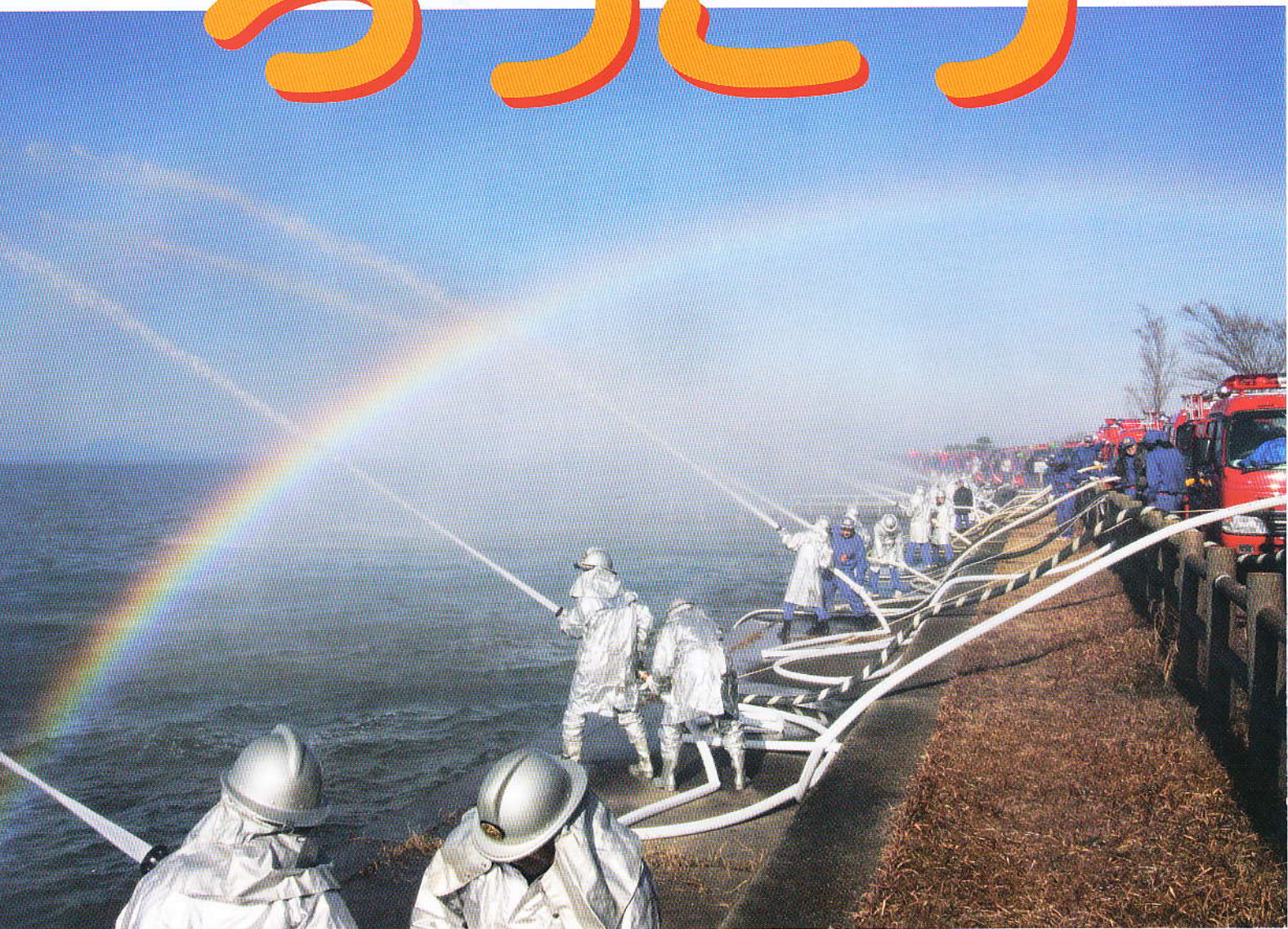
“平成 24 年消防出初め式一斉放水”（行方市）