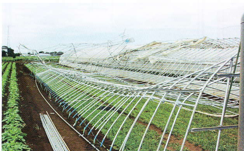
▲ 台風15号での全損被害

今後、冬場の「寒冷低気圧」・春先の「春一番」と多くの被害が予想されます。NOSAI鹿行では、現在皆さんの大切なハウスを守るため、加入推進を行っております。ぜひこの機会に、園芸施設共済へのご加入をお願い致します。おかげさまをもちまして、22年度の実績で35,744棟のご加入を頂いております。