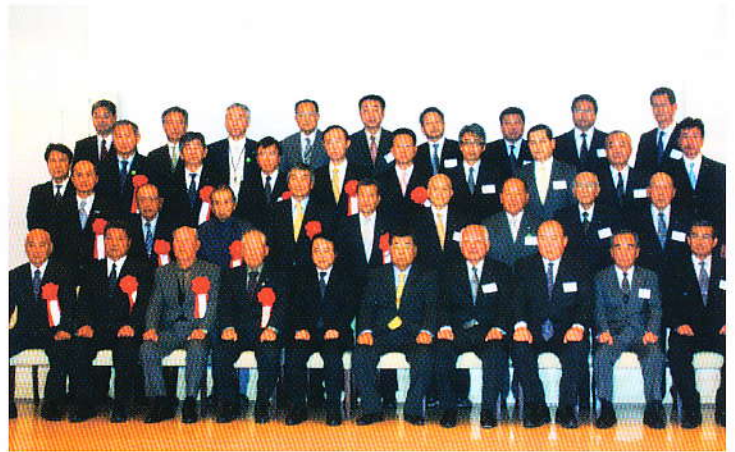
表彰者等の皆さん