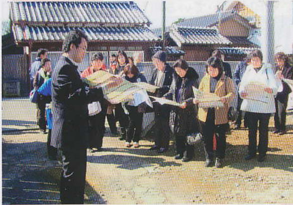
ひなまつりについて説明を受けるみなさん