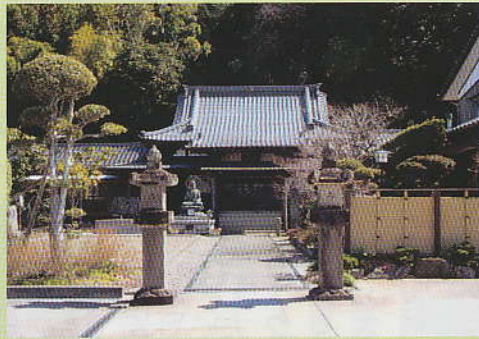
松尾芭蕉縁の寺 根本寺

鹿嶋市宮中にある瑞甕山・根本寺は、推古天皇の廿一年（613）に聖徳太子が建立したとされる勅願寺である。