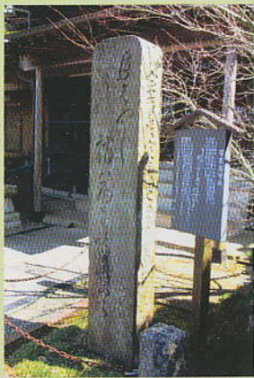
県内最古と云われる芭蕉句碑