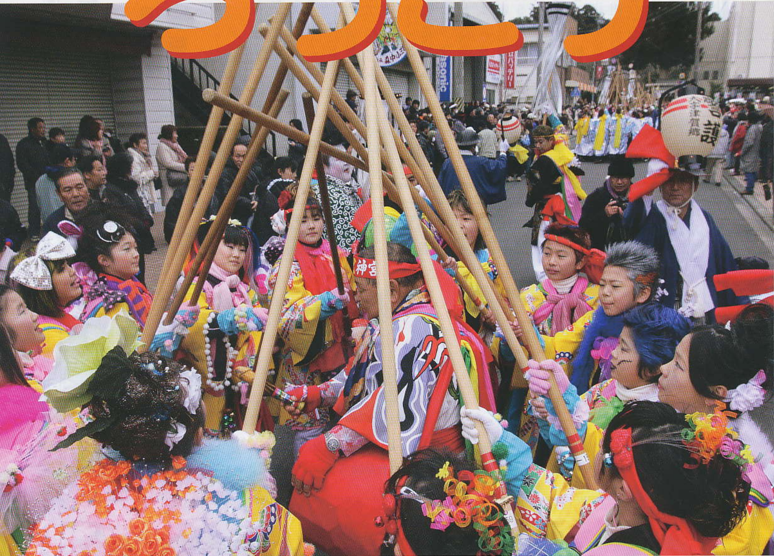
春の訪れを告げる“祭頭祭”（鹿嶋市）