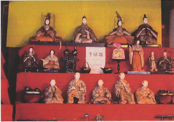
貴重な江戸時代の雛人形